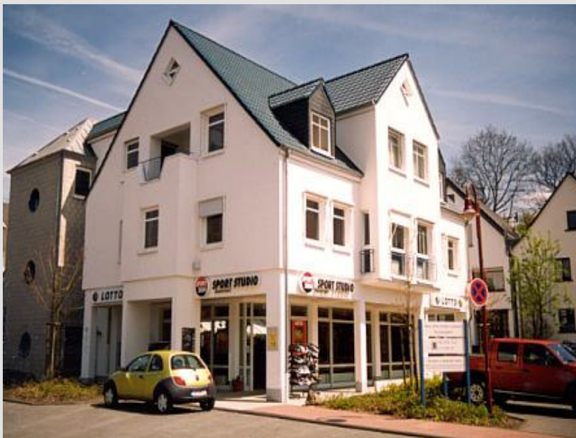
Exposé 1537 - Wohnungen

Zi.: 2, Wfl. m 2 ca.: 68, Bezug: sofort, Kautions: 3 Monatskaltmieten, Stellpl.: 1, Heizung: Zentralheizung